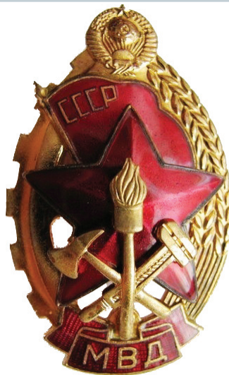
Нагрудный знак «Лучший работник пожарной охраны»

И опять - «делай как я». Через четыре тренировки бойцы уже спокойно относились к огню и чётко выполняли поставленные задачи, а те, кто не смог себя пересилить, ушли.